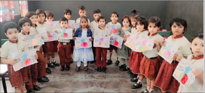
गोहाना। वित्रकला प्रतियोगिता में प्रतिभागी विद्यार्थी अपने प्रदर्श प्रदर्शित करते हुए।