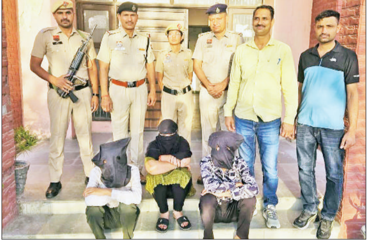
सोनीपत। पुलिस गिरफ्त में आरोपित।